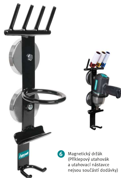
6 Magnetický držák (Příklepový utahovák a utahovací nástavce nejsou součástí dodávky)