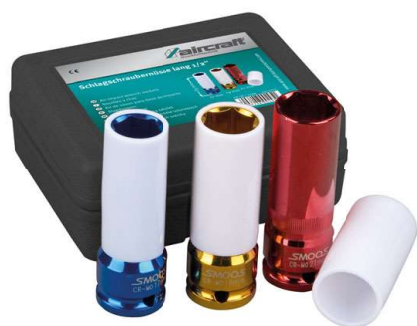
4 Utahovací nástavce 1/2" pro kola z lehkých slitin