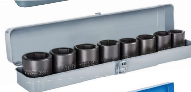
2 Sada utahovacích ořechů 3/4"