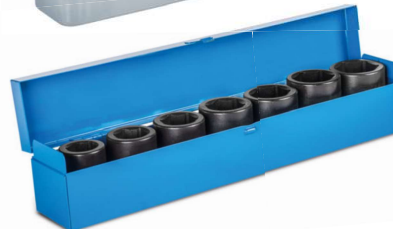
3 Sada utahovacích ořechů 1"