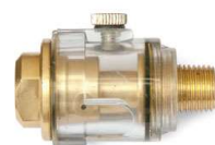
5 Hadicový přimazávač