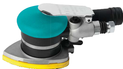
3 Delta bruska DS