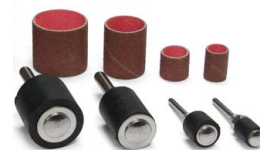
Sada brusných válečků