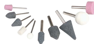
Sada brusných nástavců