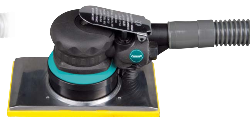
5 SWS 180 PRO