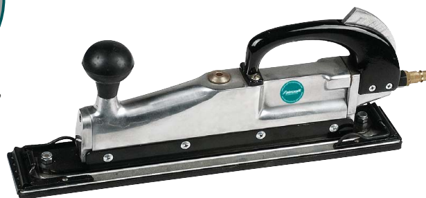
3 BDS PRO