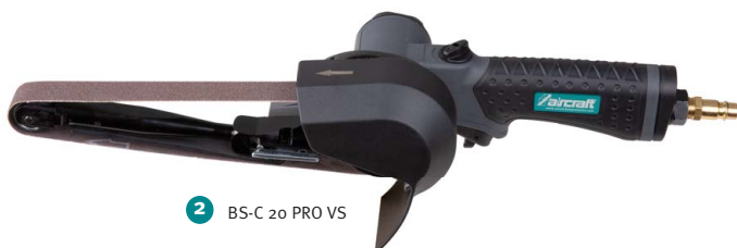
2 BS-C 20 PRO VS