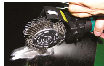
Drátěný kartáč hrubý 23 mm