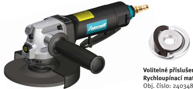
Volitelné příslušenství: Rychloupínací matice Obj. číslo: 2403484