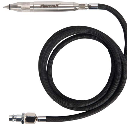
2 GS PRO