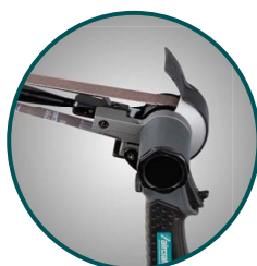
Rameno je otočné o 360°