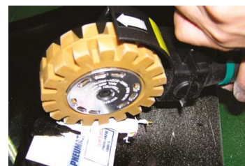
Gumový kotouč žlutý