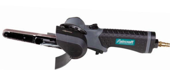
1 BS-C 10 PRO VS