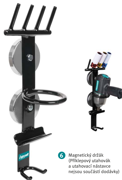
6 Magnetický držák (Příklepový utahovák a utahovací nástavce nejsou součástí dodávky)