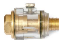
5 Hadicový přimazávač