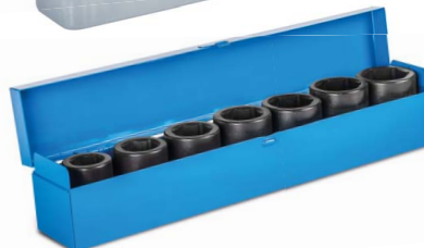
3 Sada utahovacích ořechů 1"