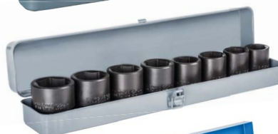
2 Sada utahovacích ořechů 3/4"